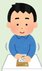
商品の バーコード シール貼り